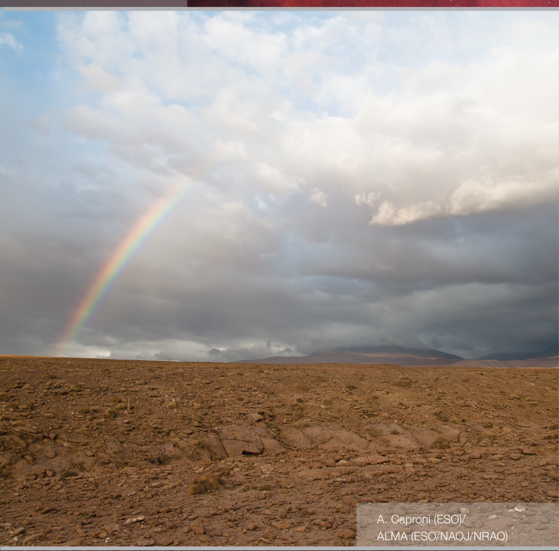
A. Ghezport, ESO/ ALMA (ESO/NAOJ/NRAO)