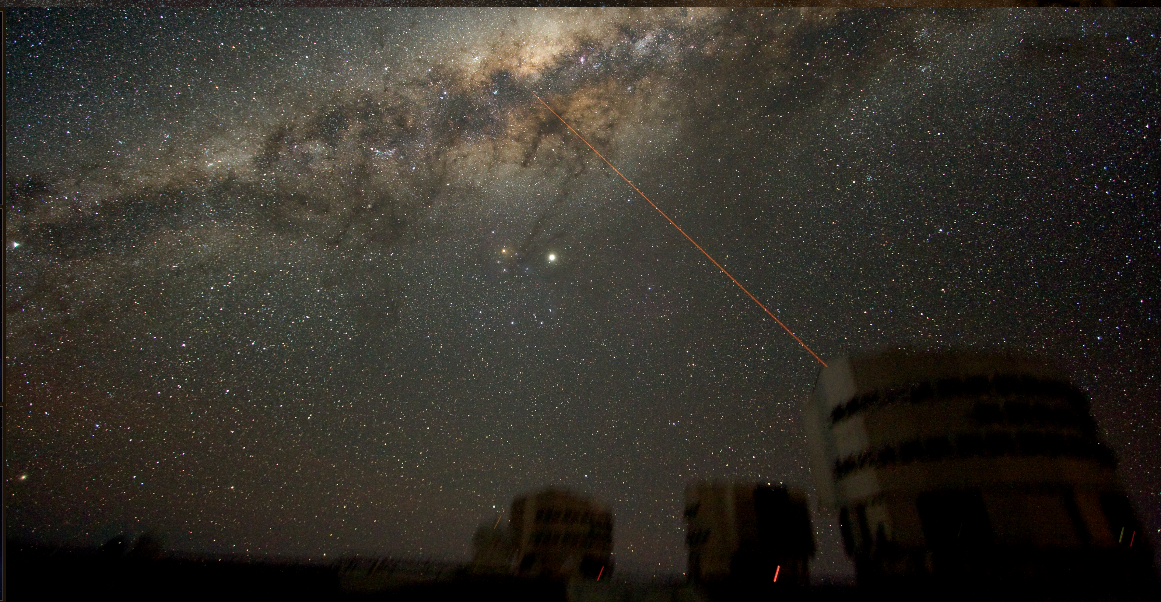
The night sky above Paranal. The VLT is observing the centre of the Milky Way. The laser beam produces an artificial guide star for the VLT's adaptive optics system.

La partes centrales de nuestra galaxia, La Vía Láctea, observadas con el Very Large Telescope en infrarrojo cercano con el instrumento NACO (izquierda). Impresión artística de una brillante "burbuja" de gas en el disco de material que rodea al agujero negro en el centro de nuestra galaxia (centro).