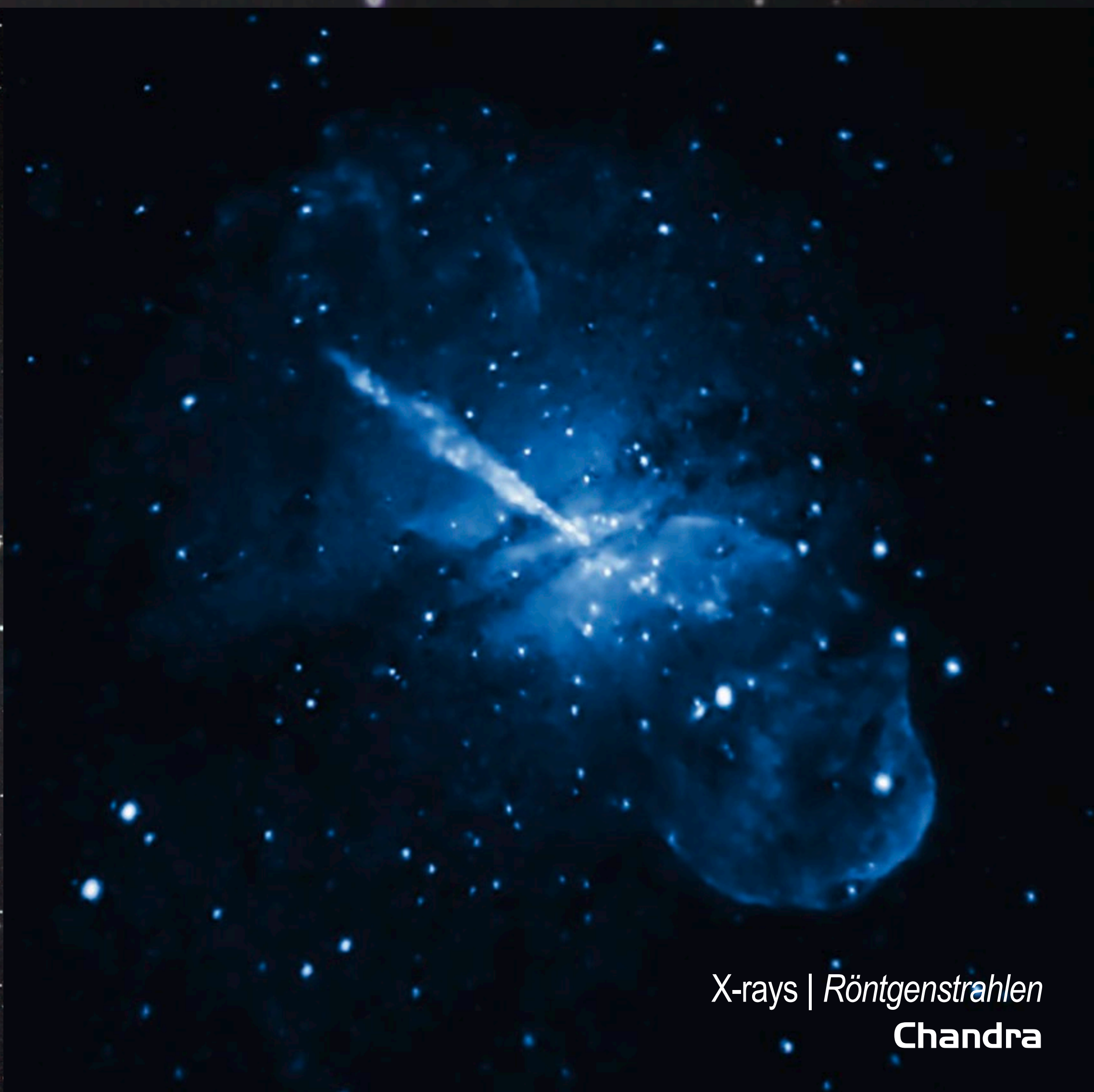
X-rays | Röntgenstrahlen Chandra