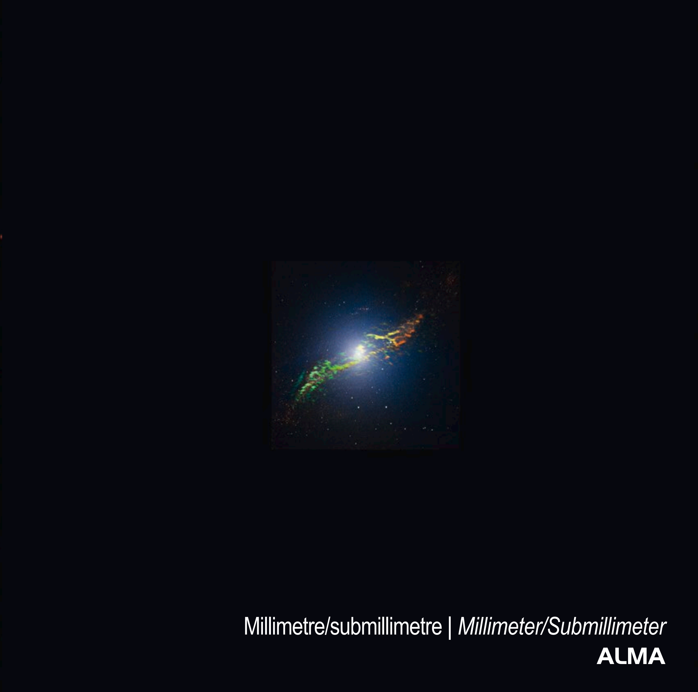
Millimetre/submillimetre | Millimeter/Submillimeter ALMA