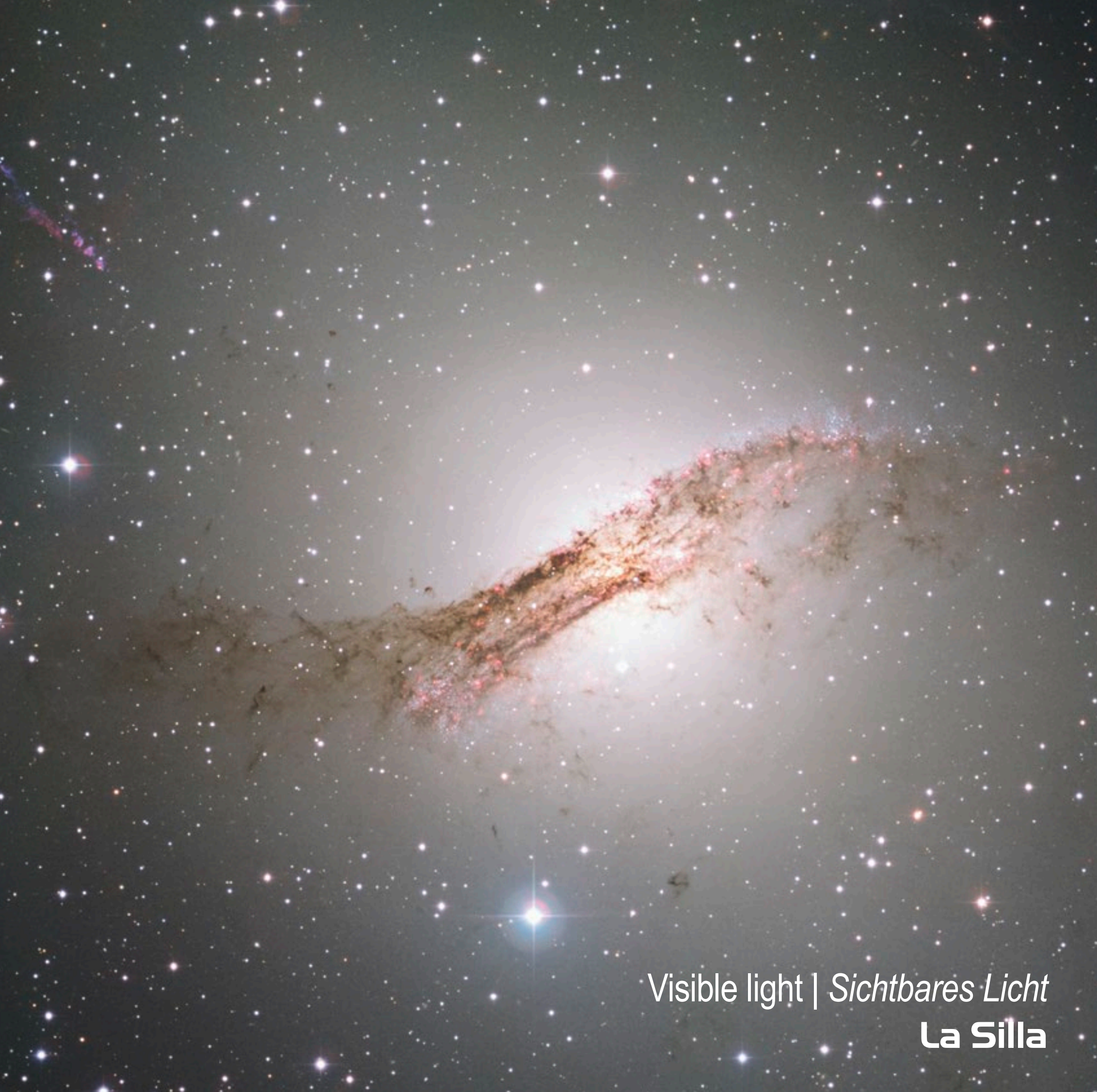
Visible light | Sichtbares Licht La Silla