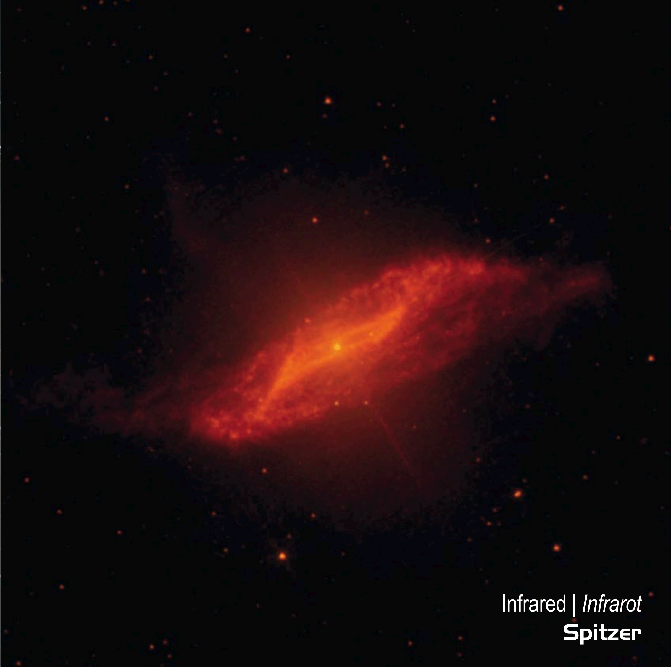
Infrared | Infrarot Spitzer