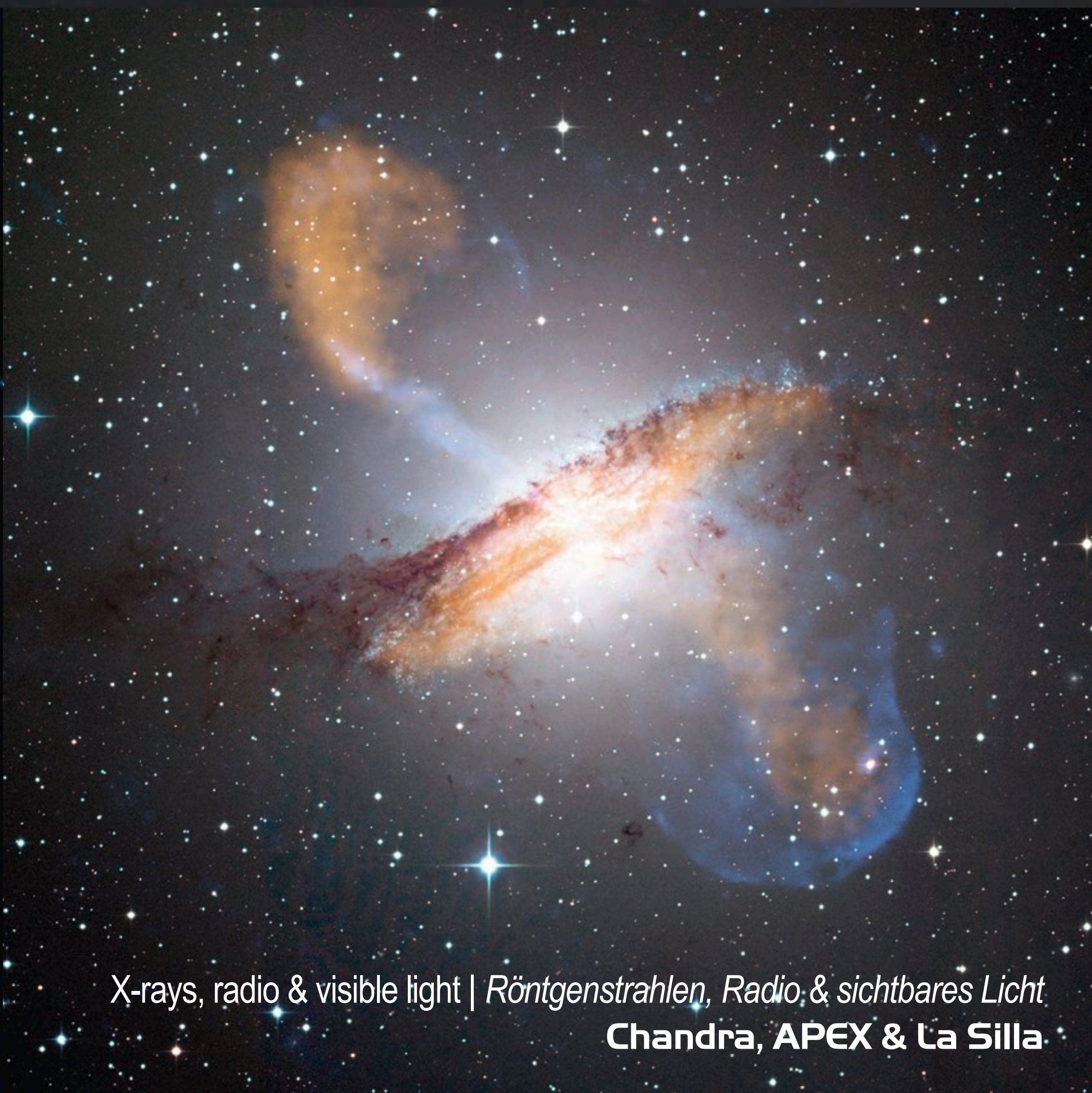
X-rays, radio & visible light | Röntgenstrahlen, Radio, & sichtbares Licht Chandra, APEX & La Silla