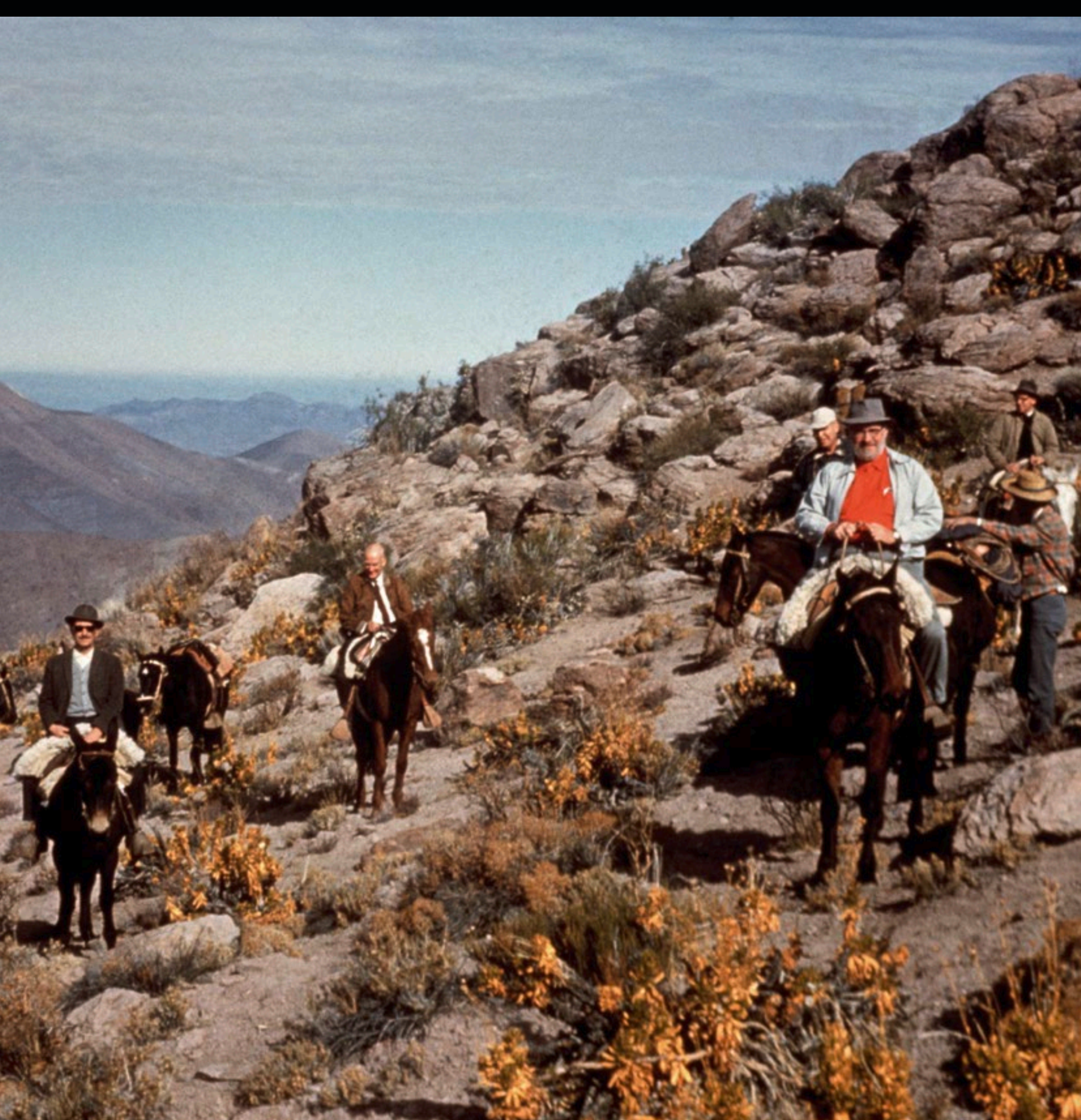
Representantes de ESO se reúnen en la cumbre de Cerro Morado (Chile), en Junio de 1963.

ESO se encuentra plenamente comprometido con la labor de promover la conservación del cielo oscuro del norte de Chile, único en el mundo. Una muestra de este compromiso es el apoyo entregado por ESO, en conjunto con otros observatorios internacionales que operan en Chile y el Gobierno chileno, a las iniciativas de protección, información y difusión pública del tema. Al compartir los resultados científicos obtenidos a través de sus telescopios, ESO espera aumentar la conciencia sobre la importancia del cielo nocturno, como uno de los más preciados recursos naturales y culturales de Chile.