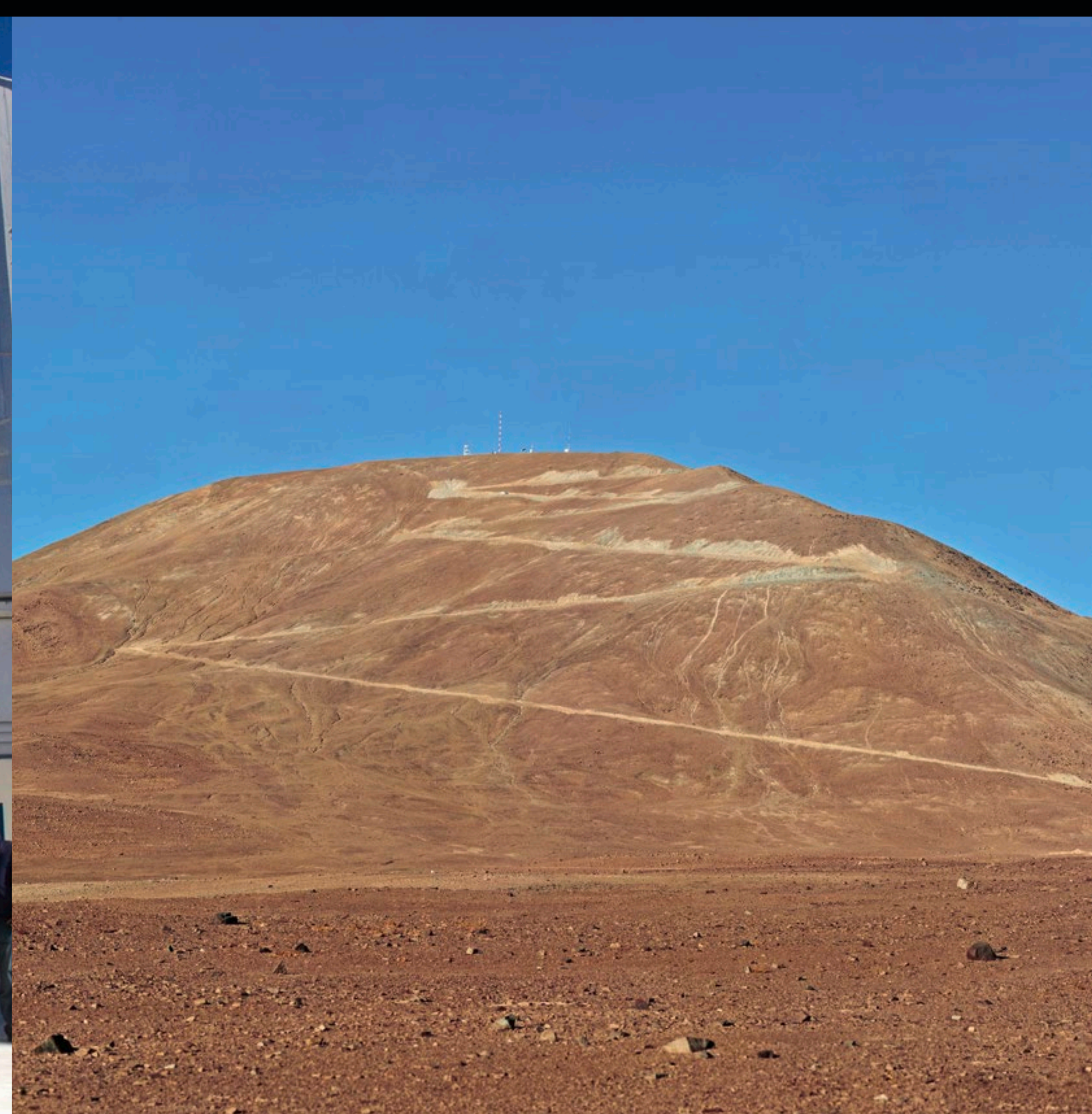
Vista de Cerro Armazones, en el desierto chileno cercano al Observatorio Paranal de ESO.