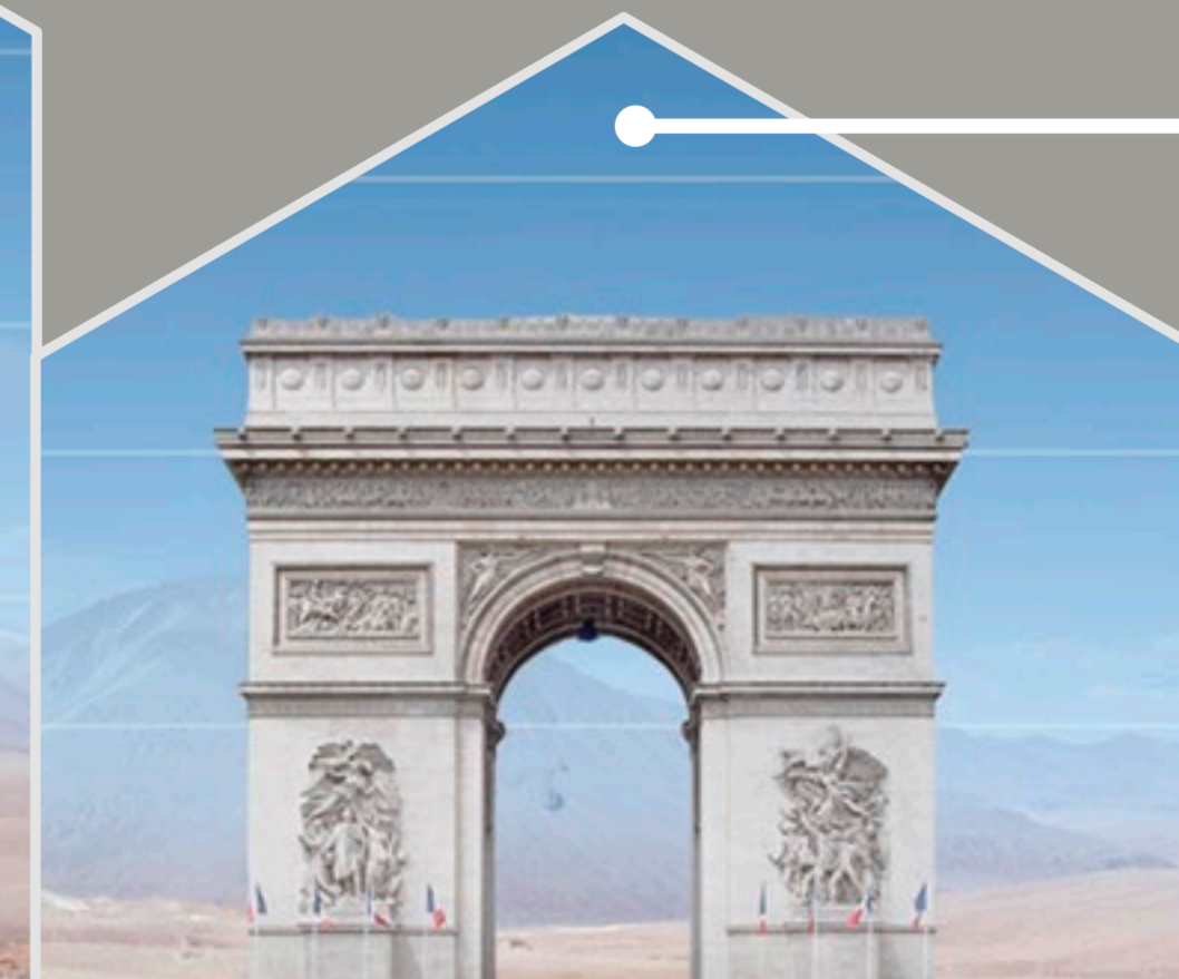
El Arco del Triunfo, París, Francia

Este hexágono tiene el tamaño real de unos de los 798 segmentos del espejo principal del ELT