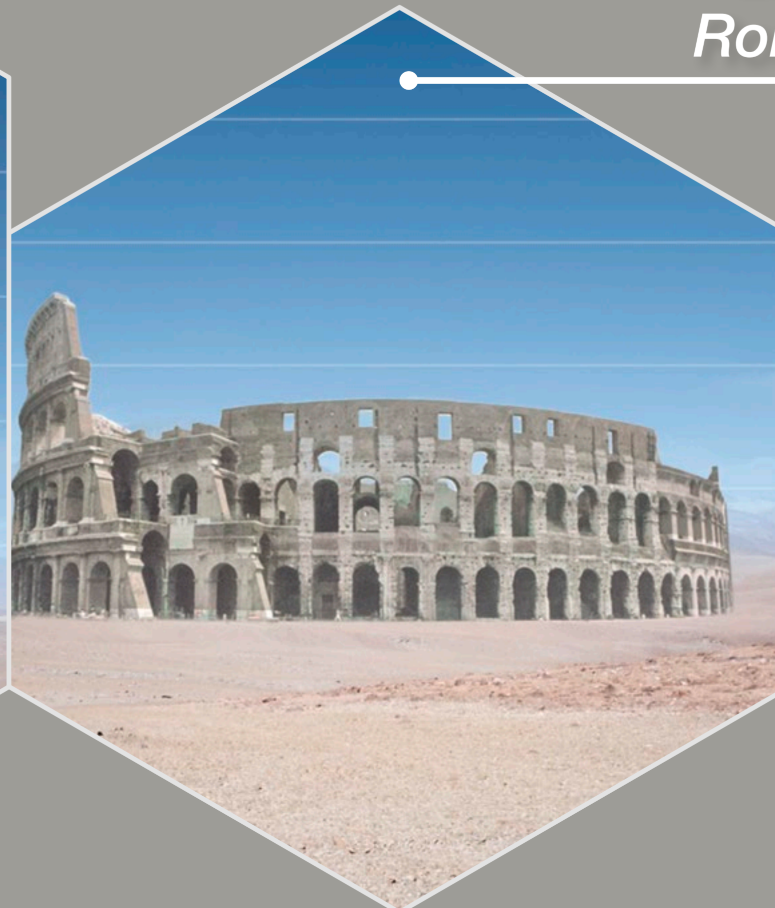
El Coliseo, Roma, Italia