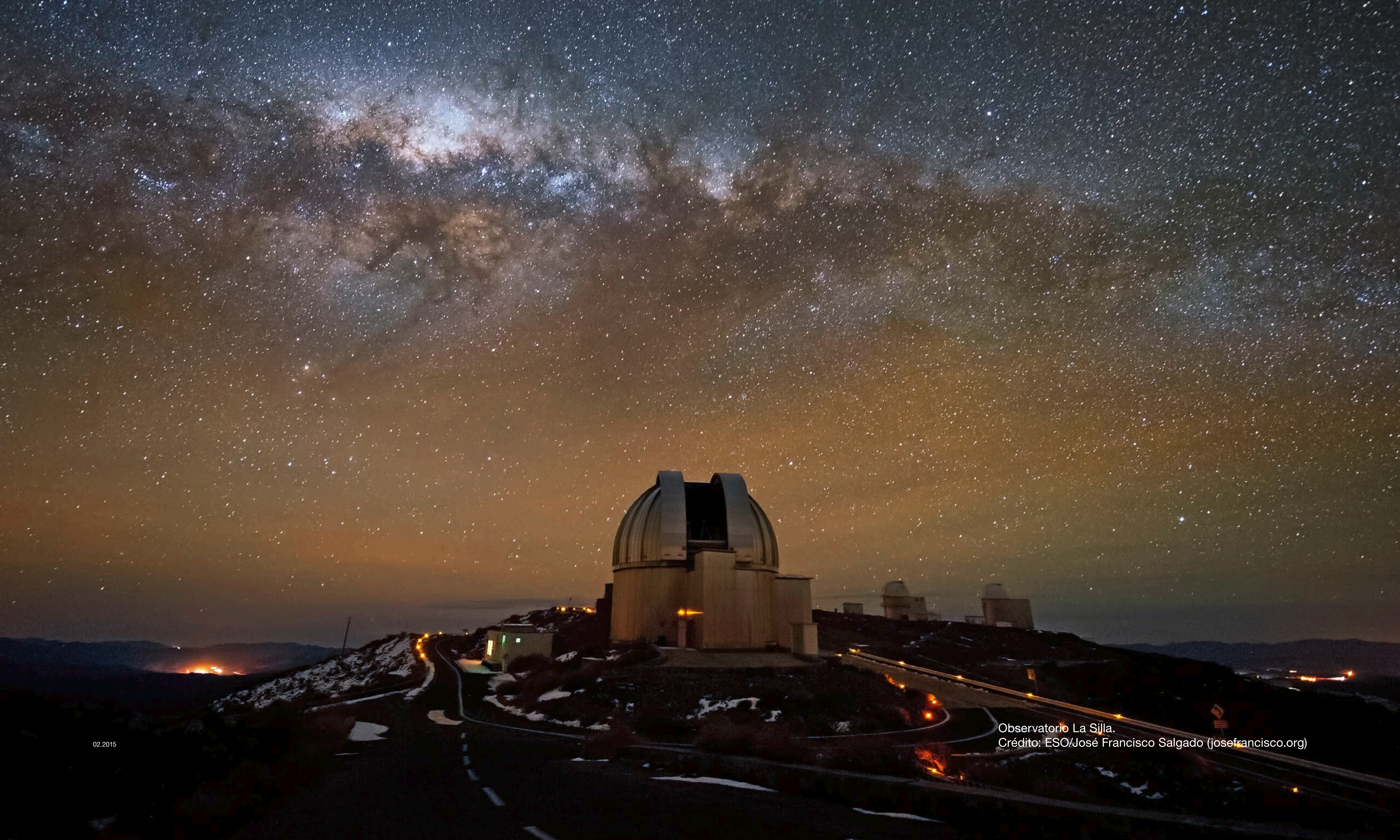
Observatorio La Silla.