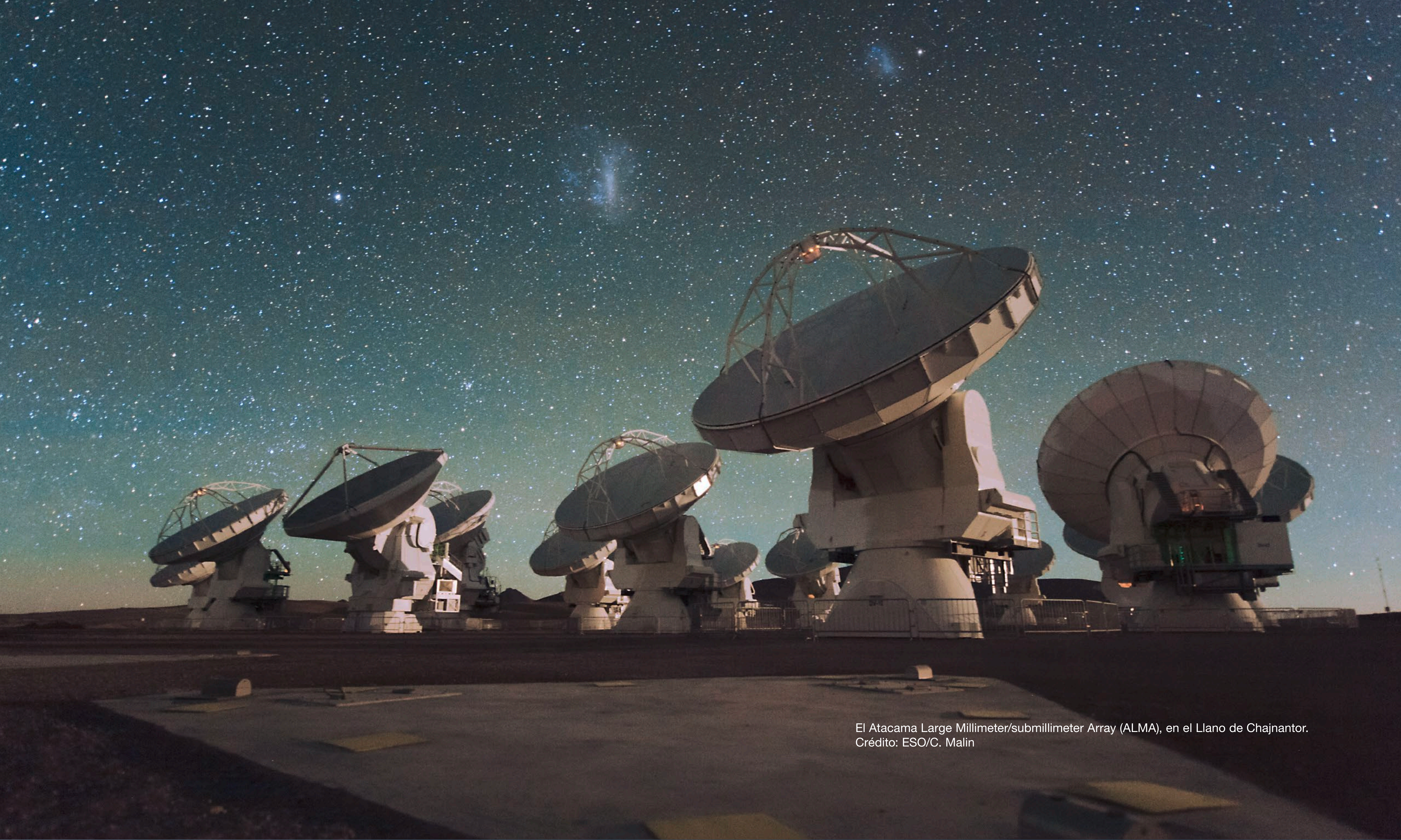
El Atacama Large Millimeter/submillimeter Array (ALMA), en el Llano de Chajnantor.