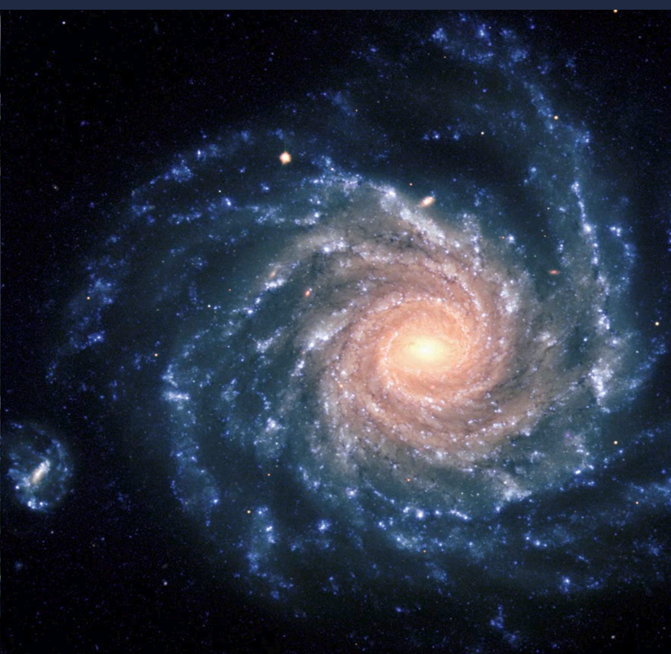
Galaxia espiral NGC 1232, captada por el VLT.