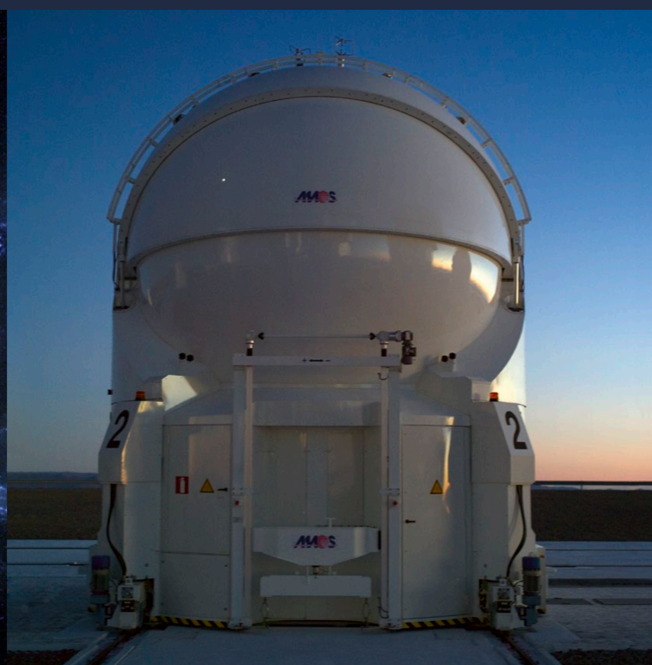
La cúpula cerrada del segundo Telescopio Auxiliar de 1,8 metros, parte del Interferómetro del Very Large Telescope, al anochecer en Paranal.