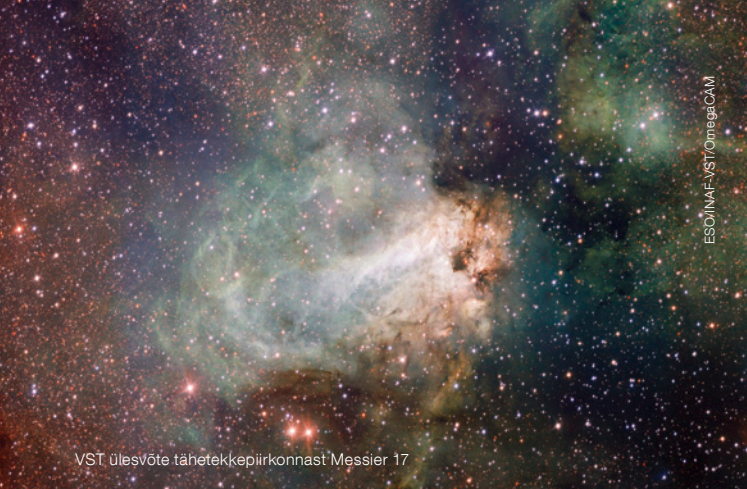
VST ülevõtte tähetekkepiirkonnast Messier 17