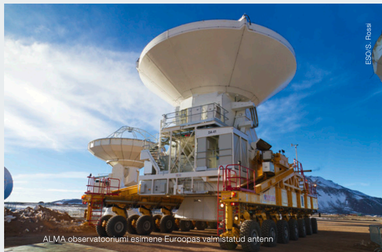
ALMA observatooriumi esimene Euroopas valmistatud antenn

Tšiilis 2600 m kõrgusel Paranali mäel paiknev Väga Suur Teleskoop ( Very Large Telescope – VLT ) on Euroopa maa-pealse astronoomia lipulaev, mis koosneb neljast 8,2-meetrise läbimõõduga peapeegli põhiteleskoobist ning neljast liigitavast 1,8-meetrise abiteleskoobist. Iga põhiteleskoobiga on võimalik näha neli miljonit korda väiksema heledusega objekte kui palja silmaga. Teleskoobid võivad töötada ka koos hiigelsuure interferomeetrina ( Very Large Telescope Interferometer – VLTi ), võimaldades uurida objekte kuni 16 korda detailsemalt kui iga teleskoobiga eraldi. VLT on kõige produktiivsem observatoorium maailmas.